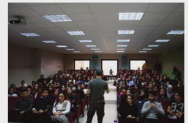
Konferansa ilgi yoğunluğu.

Konferans, katılımcıların hayallerini anlatması ve sertifika dağıtımından sonra sona erdi.