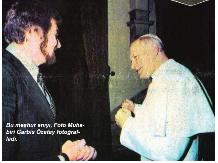
Bu meşhur anıyı, Foto Muhabiri Garbis Özatay fotoğrafladı.

Erus, uzun yıllar habercilik yaptığı İtalya’nın gazeteciler için korunaklı bir yer olduğunu anlatıyor bize: “İtalya’da basın çalışanlarının sosyal hakları üst düzeyde. Gazeteciler sırtını sendikalara dayıyor. Her ne olursa olsun sendikalar gazetecilerin arkasında duruyor.”