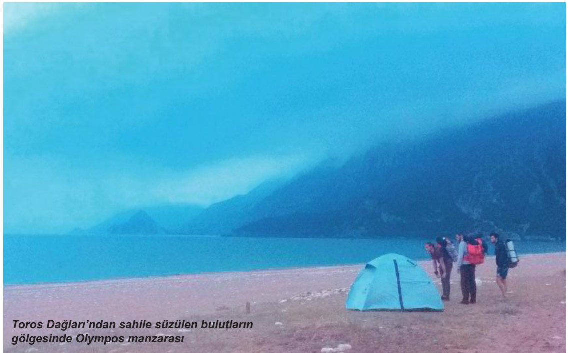
Toros Dağları'ndan sahile süzülen bulutların gölgesinde Olympos manzarası

kişilik kapasiteye sahip olduğu biliniyor. Bulunduğu bölge itibarıyla Türkiye'de deniz manzaralı tek tiyatro olma özelliğini taşıyor. Denizin hemen yakınında olması sebebiyle bölgeye ayrı bir hava katıyor. Kaş tatiline çıkacaklara tavsiyem ise kesinlikle antik tiyatrodaki oturup deniz manzarası karşısında kafa dinlemeniz olacaktır.