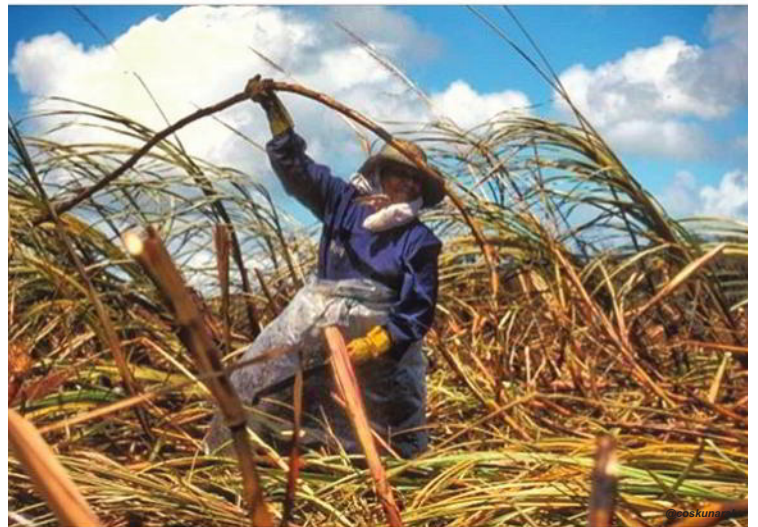
Mauritius'ta şeker kamışı tarlasında hasat.

Beni de en çok heyecanlandıran savaş muhabirliğinden konuşalım istiyorum. Ne de olsa bu alanda uluslararası ün sahibi, birçok ödüle layık görülmüş tecrübeli bir savaş muhabiri oturuyor yanımda.