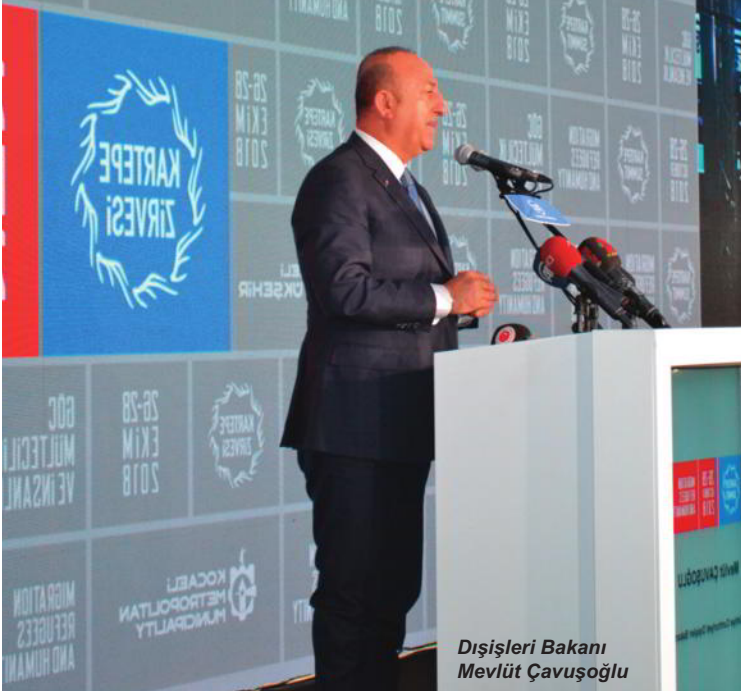
Dış İşleri Bakanı Mevlüt Çavuşoğlu

Kartepe Kocaeli Büyükşehir Belediyesi'nin bu yıl ikincisini düzenlediği Kartepe Zirvesi'nde farklı ülkelerden medya, siyaset, bilim ve akademi dünyasından katılımcılar yer aldı. Göç, Mültecilik ve İnsanlık başlığı altında araştırmaların ve istatistiki bilgilerin paylaşıldığı zirvede alınabilecek önlemler ve çözüm önerileri de sunuldu.