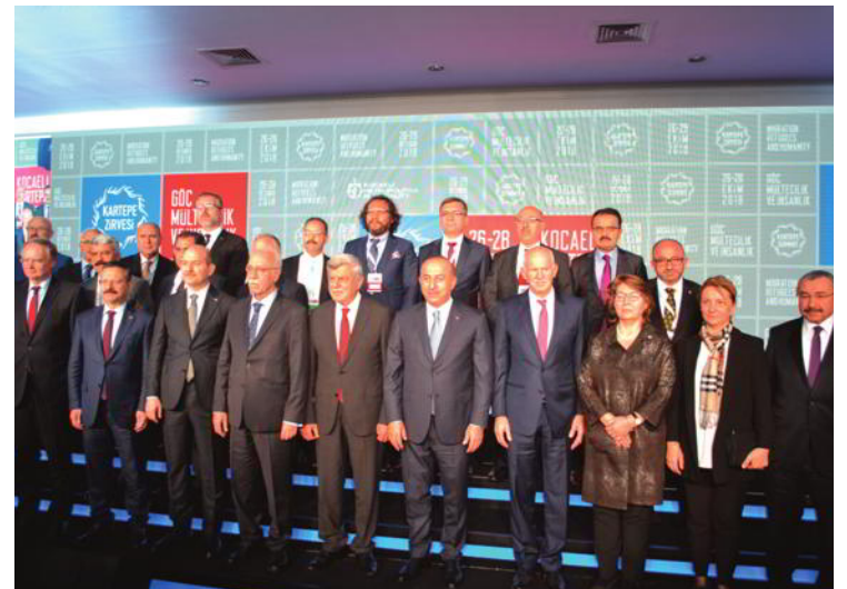
Devlet erkânı ve yabancı yatırımcılar Kartepe Zirvesi'nde bir araya geldi.