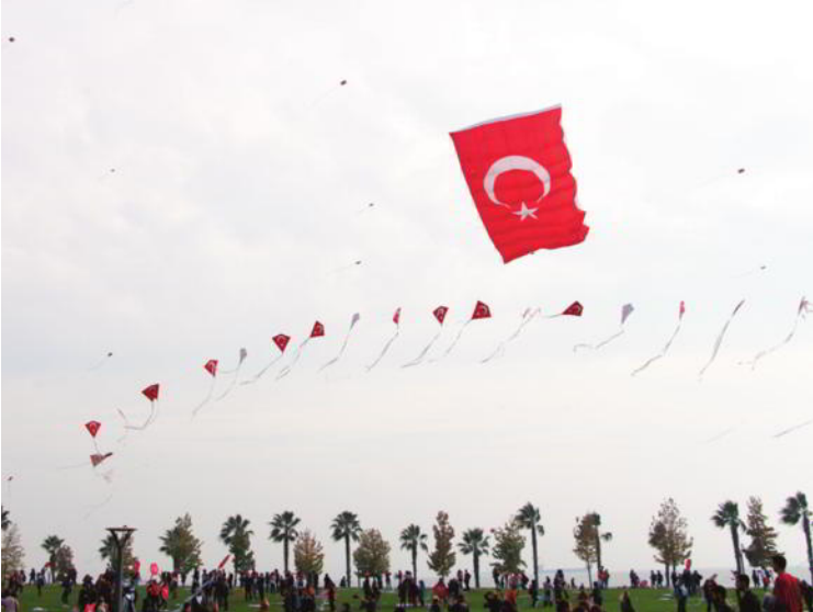
Dev Türk Bayrağı havalandı.

Uçurtmalar dağıtıldıktan sonra 60 metre yükseklikte Ay yıldızlı uçurtma havalandırıldı ve gökyüzü birkaç dakikalığına kırmızı-beyaza boyandı. Uçurtma Festivali katılımcılara teşekkür sertifikalarının verilmesiyle birlikte sona erdi.