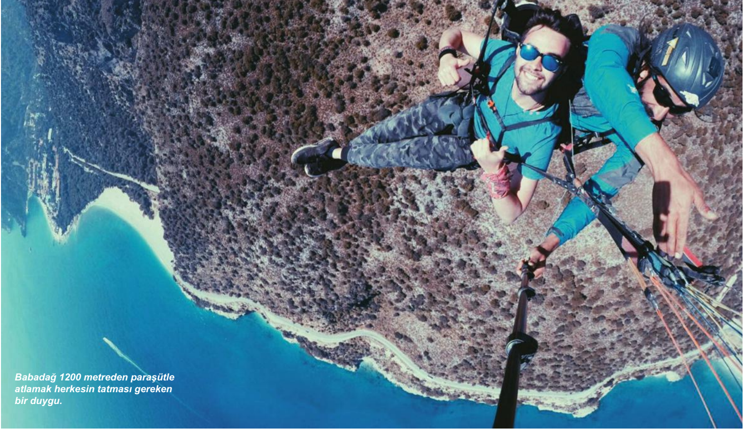
Babadağ 1200 metreden paraşütle atlamak herkesin tatması gereken bir duygu.

Ölüdeniz' in adeta sırtını dayadığı Babadağ, bölgede yamaç paraşütü sporunun yapıldığı ilk yer. Ayrıca burası, Avrupa'da bin 900 metre yüksekliğe çıkarak denizin üstüne atlanan tek yer olma özelliği taşıyor. Ben de bu özelliğin keyfini çıkarmak için paraşüt yoluna koyuluyorum. Anlaştığımız paraşüt firması sizi Ölüdeniz 'den alıp Babadağ'a kadar çıkarıyor. Heyecan, yükseklik arttıkça daha fazla katlanıyor fakat aynı zamanda sabırsızlık da başlıyor. Şu sıralar Babadağ zirvesinde yani 2 bin metrede teleferik çalışması olduğu için bin 200 metreden atlanılıyor. Dağa tırmanış yolculuğunun ardından sonunda atlama noktasına ulaşıyorum.