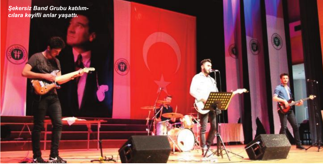
Şekersiz Band Grubu katılımcılara keyifli anlar yaşattı.

Kocaeli Üniversitesi İletişim Kulübü (KÜİK), Ajans Woor ve KOÜ İletişim Fakültesi Halkla İlişkiler Bölümü tarafından ortaklaşa İletişim Festivali düzenlendi. Festival, gerçekleşen ses yarışmasının ardından Prof.Dr.Baki Komsuoğlu Kültür ve Kongre Merkezi'nde çeşitli söyleşiler ile devam etti.