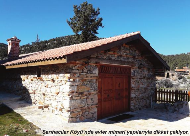
Sarıhacılar Köyü'nde evler mimari yapılarıyla dikkat çekiyor.