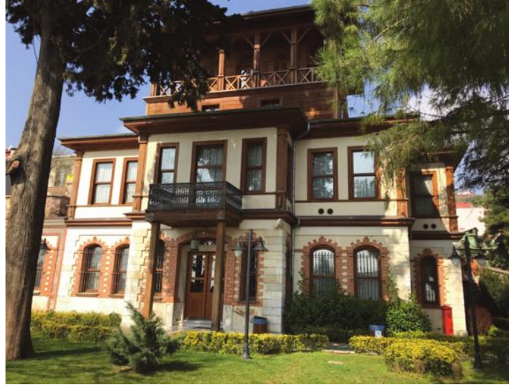
Selim Sırrı Paşa Konağı, Kapanca Sokak'ta bulunuyor.

İzmit'in dar sokaklarından geçerek ulaşıyorum Kapanca Sokağı'na. Sokağa girer girmez alışılmış parke taşlarının yerine arnavut kaldırım döşemeleri selamlıyor beni. Kentsel sit alanı içinde kalan, yolun her iki tarafında mimarisine hayran bırakan yapıların olduğu bu sokakta tarihi birer çeşme, sarnıç ve okul bulunuyor. Eski tarihsel dokuyu muhafaza eden sokağın en görkemli yapısını ise yokuşun üzerinde beni selamlayan Selim Sırrı Paşa Konağı oluşturuyor. Daha ilk bakışta insanı kendisine hayran bırakan konağın kapısından geçip bahçesine giriyorum. Bahçede uzunca çam ve birkaç bodur meyve ağacının arasından geçerek anlaşıp girilmiş kapısına