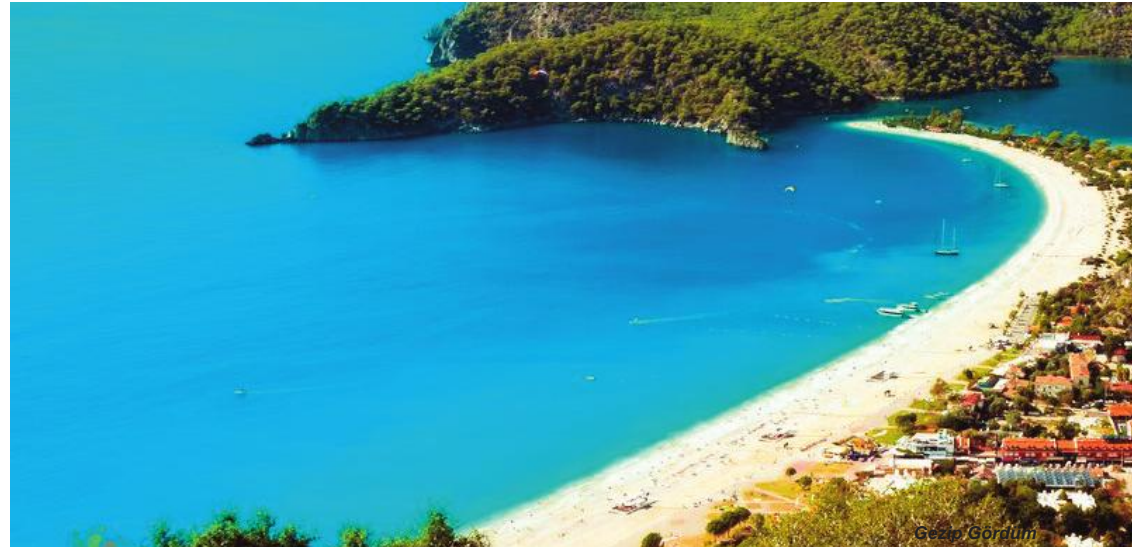
Gezi / Görüm

manın içerisine doğru ilerlediğimde buz gibi suyuyla Aladere Şelalesi karşıyor beni. Çam ağaçlarının gölgesine çadırımı atarak gün batımının keyfini çıkarıyorum. Sessiz, huzurlu ve yıldızlar altında bir gece geçirip sabah uyanıldığında karşılaştığım manzarayla büyüleniyorum. Koyun sessizliğini bölen dalga sesleri adeta terapi gibi geliyor. Çadırdan çıktığım an olağanüstü dağ manzarası beni karşılar bahar çiçeklerinin kokusu ciğerlerime doluyor. Sabahları oturup denizi izlemek mükemmel bir keyif, siz denize dalmış izlerken kırlangıç kuşlarının gösterisi başlıyor. Bu onların insanlara günaydın deme şekli adeta. Kabak Koyu, hamağımı alıp huzuru koklamak isteyenler için biçilmiş bir kaftan.