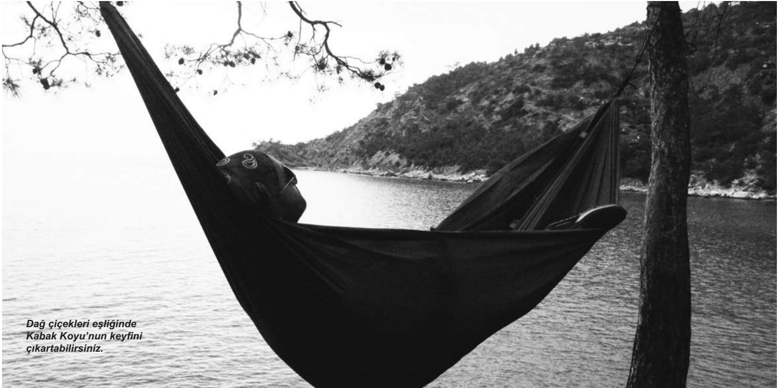
Dağ çiçekleri eşliğinde Kabak Koyu'nun keyfini çıkartabilirsiniz.

Her türlü deniz sporunun yapılabildiği Ölüdeniz'de safari, dağcılık, yürüyüş ve raf-ting'in yanı sıra Babadağ'dan 2 bin metre yükseklikten yamaç paraşütü ile atlama imkanı da var.