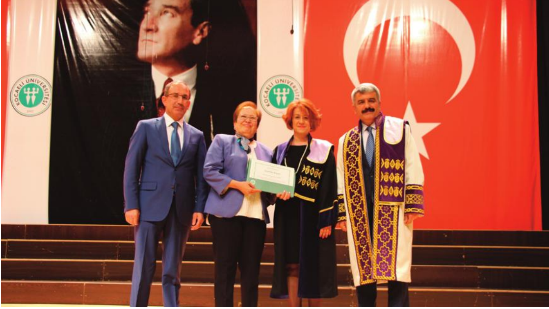
KOÜ Akademik Giysi Töreni'nde En Çok Yayın Yapan Akademisyen ödülleri de verildi.