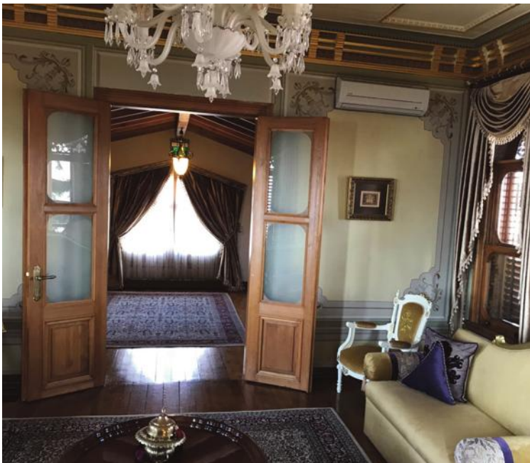
Konakta Paşa'nın birebir eşyaları bulunamadığı için, o döneme ait olan mobilyalar antikacıardan alınarak konağa yerleştirilmiştir.

Son kat olan üçüncü kata doğru çıkıyorum ve merdivenlerin sonuna geldiğimde odanın içine düşen güneş ışıkları, duvarlarda bulunan dönemin kültürünü yansıtan eserler ve parça parça çekilmiş fotoğrafların birleştirilmesinden oluşturulmuş İzmit'in panoramik tablosu beni yeniden o tarihlerin içine doğru çekiyor. Bu kat Cihannüma olarak adlandırılıyor ve şehrin tamamını seyredebilmemizi sağlayan balkonuyla Sırrı Selim Paşa Konağı adeta İzmit'i tepeden selamlıyor. Her dokusuna tarihi hissetmek ve zamanda yolculuk yapmak isteyen ziyaretçileri için Sırrı Selim Paşa Konağı İzmit'in merkezinde asırlık bir yapı olarak korunuyor.