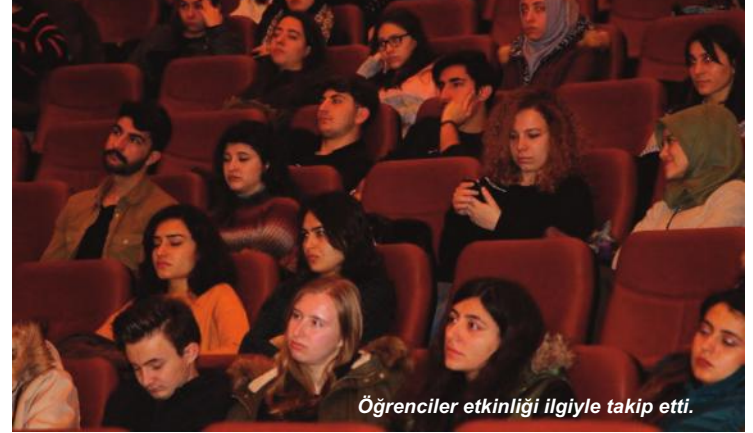
Öğrenciler etkinliği ilgiyle takip etti.

Kocaeli Üniversitesi Prof. Dr. Baki Komsuoğlu Konferans Salonu'nda KOÜ İşletme Kulübü'nün öncülüğünde Kariyer Günleri düzenlendi.