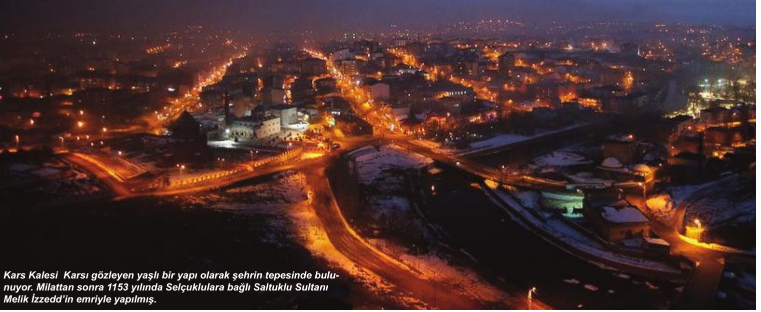
Kars Kalesi Karşı gözleyen yaşlı bir yapı olarak şehrin tepesinde bulunuyor. Milattan sonra 1153 yılında Selçuklulara bağlı Saltuklu Sultanı Melik İzzedd'in emriyle yapılmış.