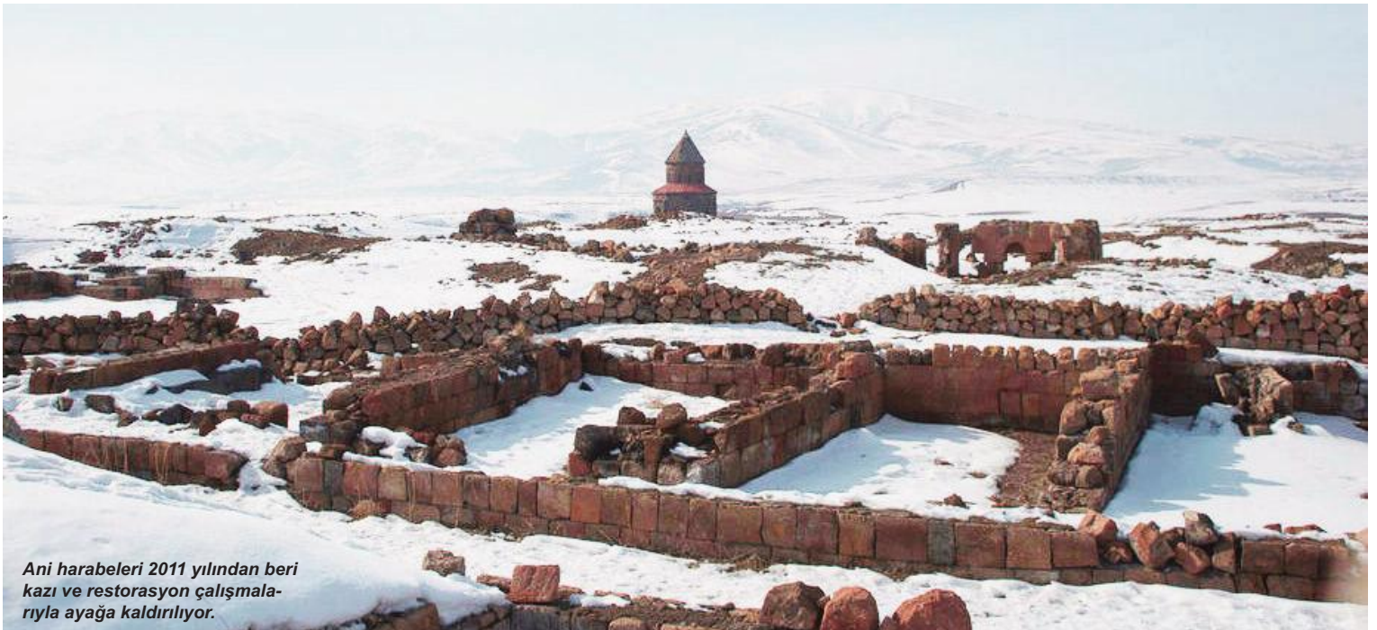
Ani harabeleri 2011 yılından beri kazı ve restorasyon çalışmalarlarıyla ayağa kaldırılıyor.

Sıra geldi kış turizminin önemli merkezlerinden biri olan Sarıkamış'a. Aynı zamanda önemli bir kültürel mirasa da sahip olan Sarıkamış, Alahuekber Dağları Milli Parkı içerisinde yer alan kayak merkeziyle hava alanına yarım saat mesafede bulunuyor. Sarıkamış Kayak Merkezi'ni önemli yapan özelliği en uzun kalıcı kara sahip olması. Öyle ki burada kimi yıllar kayak sezonu mart ayının sonuna kadar devam ediyor. Kayak merkezinin bir diğer özelliği ise Alplerden sonra kristal kara sahip tek kayak merkezi olması. Sarıkamış'da benim en çok hoşuma giden olay ise teleferikle zirveye yolculuk yaparken sessizliği dinlemek oldu. Sarıkamış sessizliğinin eşsiz güzelliğini dinleyebileceğiniz muazzam bir yer. Kars gezimizin sonuna gelirken biraz da halkından bahsedelim. Bir turizm merkezi olması nedeniyle farklı bölgelerden ve hatta ülkelerden insanları ağırlayan Karşılılar oldukça yardımsever. Halkının bu özelliği sayesinde şehri gezerken fazla zorluk çekmiyorsunuz tabii ki soğuşu iliklerinize kadar hissetmenizi saymazsak.