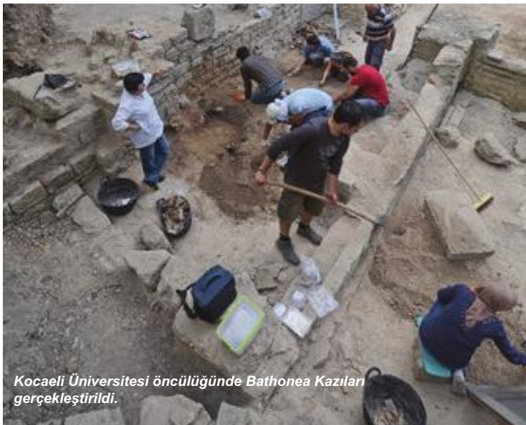
Kocaeli Üniversitesi öncülüğünde Bathonea Kazıları gerçekleştirildi.