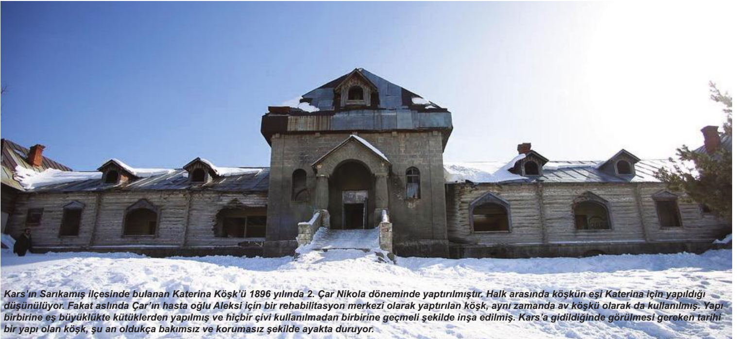
Kars'ın Sarıkamış ilçesinde bulunan Katerina Köşk'ü 1896 yılında 2. Çar Nikola döneminde yaptırılmıştır. Halk arasında köşkün eşi Katerina için yapıldığı düşünülüyor. Fakat aslında Çar'ın hasta oğlu Aleksî için bir rehabilitasyon merkezi olarak yaptırılan köşk, aynı zamanda av köşkü olarak da kullanılmış. Yapı birbirine eş büyüklükte kütüklerden yapılmış ve hiçbir çivi kullanılmadan birbirine geçmeli şekilde inşa edilmiş. Kars'a gidildiğinde görülmesi gereken tarihi bir yapı olan köşk, şu an oldukça bakımsız ve korumasız şekilde ayakta duruyor.

Kars'ta her bütçeye uygun otel ve pansiyonlar bulunuyor. Biz öğrenci grubu olarak gittiğimiz için daha uygun bir otel araştırmasına giriştik ve geceliği 30 TL olan bir otelde 3 gece geçirdik. Uzun tren yolculuğunun ardından güzel bir yemek istiyor insan haliyle. Kars'ın bir diğer avantajı da yemek olsa gerek. Çünkü bu kentte et ürünleri fiyat bakımından batı illerine göre biraz daha uygun olmasının yanı sıra dürüm kebab gibi yiyecekler de oldukça lezzetli. Karnımızı da doyurduktan sonra Kars'ı keşfetmek için yola koyuluyoruz.