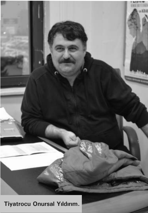
Tiyatrocuyu Onursal Yıldırım.

Röportajımızın devam ettiği esnada odaya giren