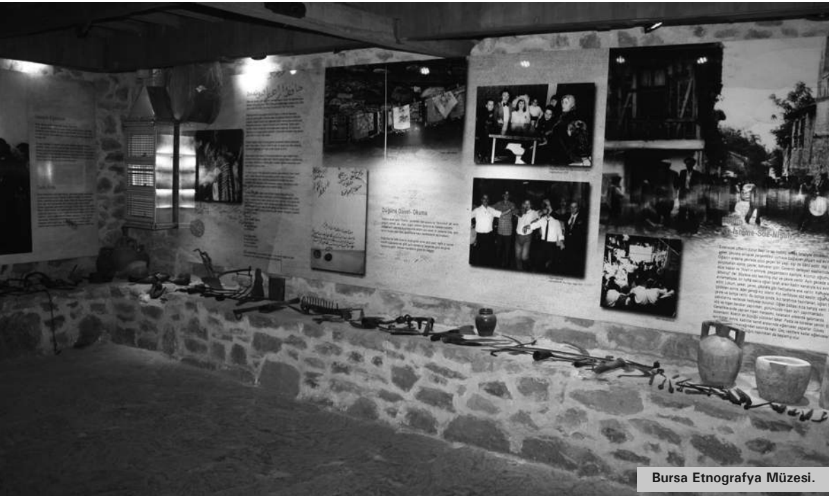
Bursa Etnografya Müzesi.

Havanın hafiften kararması bizi biraz üzüyor. Son umut deyip birkaç tane daha fotoğraf çekerek en az bir saat daha oyalandığımız Cumalıkızık Köyü, bizlere mimari- siyle, kahvaltısıyla, tarihi dokusuyla ve köylülerin güler yüzleriyle inanılmaz bir gün yaşattı.