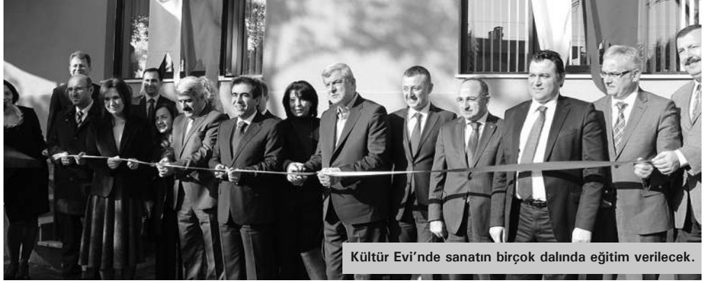
Kültür Evi'nde sanatın birçok dalında eğitim verilecek.