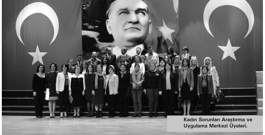
Kadın Sorunları Araştırma ve Uygulama Merkezi Üyeleri.