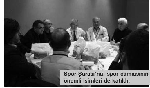
Spor Şurası'na, spor camiasının önemli isimleri de katıldı.

Sporun geleceği ve mevcut durumun değerlendirilmesi için İzmit Belediyesi tarafından ilk kez düzenlenen, 'Spor Şurası'nda spor camiası bir araya geldi. Spor alanında önemli isimlerin katıldığı panel, gün boyu süren toplantılarla devam etti.