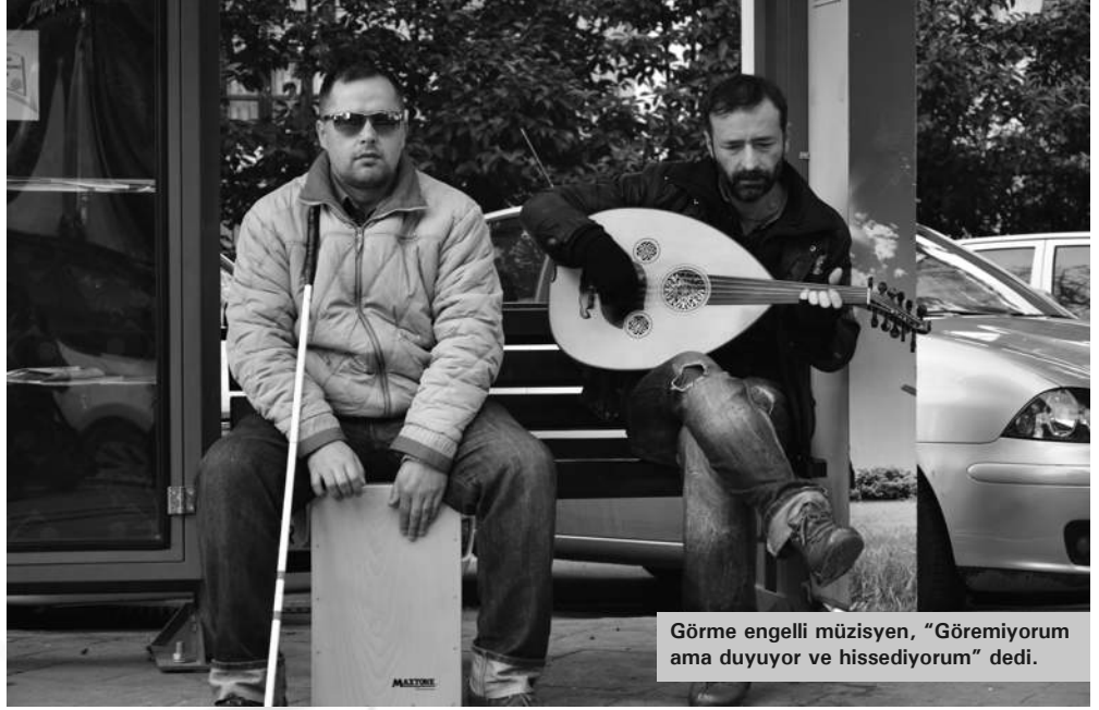
Görme engelli müzisyen, "Göremiyorum ama duyuyor ve hissediyorum" dedi.

Metroda koşuşturarak trene yetişmeye çalışırken kulağınıza çalınan bir gitar sesinin sahibini ya da sokakta yürürken en sevdiğiniz şarkının sözlerini bir anda size duyuran müzisyenlerin kim olduklarını hiç merak ettiniz mi? Biz ettik ve sokakları sesleriyle renklendiren, gelen ritimle bir anda bizi farklı bir atmosfere sürükleyen sokak müzisyenlerinin sahnesine konuk olduk.