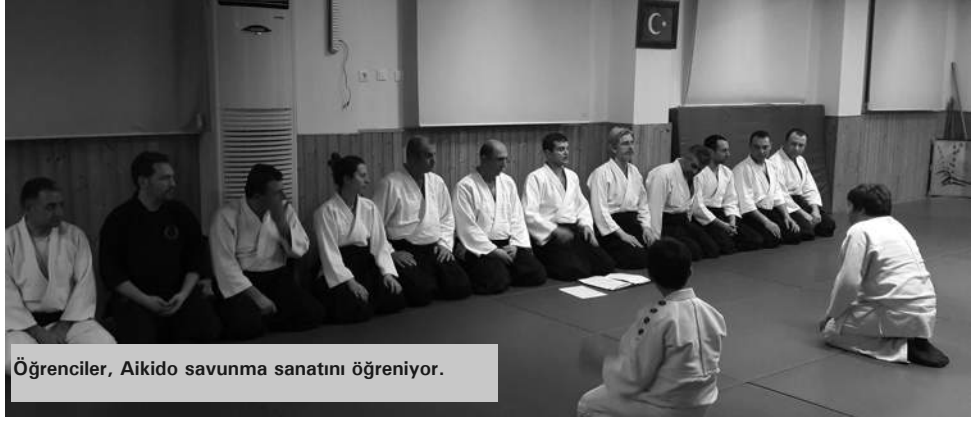
Öğrenciler, Aikido savunma sanatını öğreniyor.

Elbette biraz önce bahsettiğim özelliği Aikido'nun sadece spor maksatlı bir eğitim biçimi olmadığını. Bu özelliği nedeniyle içerisinde rekabet unsurlarını barındırmaz. Rekabet oluşması için de kurucusu tarafından müsabaka yapılması yasaklanmıştır. Yani Aikido'da yarışma kavramı yoktur. Bunun dışında Aikido eğitimi almaya yeni başlamış öğrenciler hem teknik, hem de ruhsal gelişimleri için cevapları hemen alamazlar. O yüzden Aikido oldukça sabır