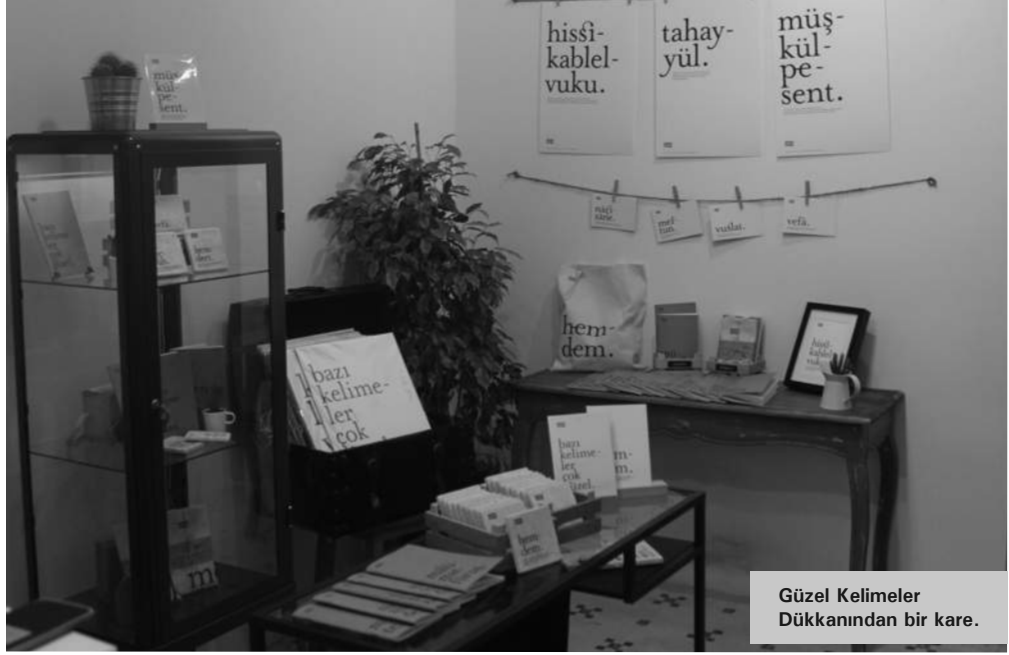
Güzel Kelimeler Dükkanından bir kare.